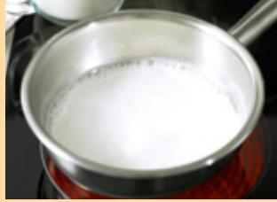
1. قومي بمزج رقائق الحبوب مع الحليب وغليه.