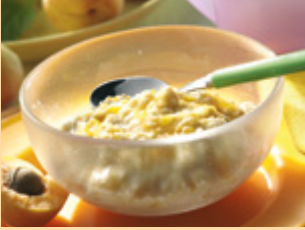
4. الأكل جاهز.