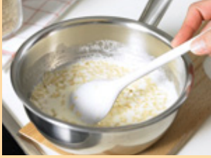
2. اتركه يغلي.