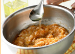
3. أضيفي زيت اللفت.