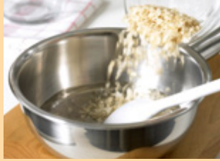
1. قومي بمزج رقائق الحبوب مع المياه، وغليها وتركها تغلي.