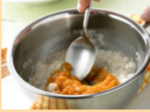
2. أضيفي فاكهة طازجة ومهروسة.