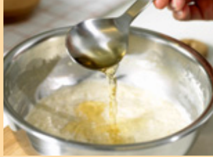
3. أضيفي عصير الفاكهة.