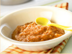
4. الأكل جاهز.