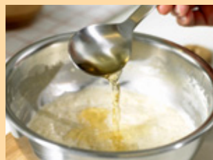
3. Ввести фруктовый сок.