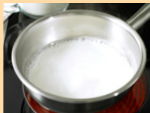
1. Зерновые хлопья размешать в молоке и довести до кипения.