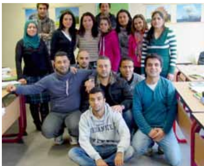
Teilnehmer eines Integrationskurses in Ludwigslust

Gute Deutschkenntnisse sind der Schlüssel für erfolgreiche Integration und Voraussetzung für eine Eingliederung in den Arbeitsmarkt. Die gemeinsame Sprache ist außerdem wichtig für das friedliche Zusammenleben von Menschen unterschiedlicher Herkunft. Eine intensive Sprachförderung hat daher bei Neuzuwanderern, aber auch bei Zuwanderern, die bereits länger hier leben, hohe Priorität. Die Vhs Ludwigslust-Parchim als vom Bundesamt für Migration und Flüchtlinge anerkannter Sprachkursträger führt an den Standorten Ludwigslust, Hagenow und Parchim regelmäßig neue Integrationskurse durch, die aus einem Sprachkurs und einem Orientierungskurs bestehen. Im Sprachkurs werden wichtige Themen des alltäglichen Lebens behandelt, wie z.B. Einkaufen und Wohnen, Arbeit und Beruf, Ausbildung und Erziehung von Kindern, Gesundheit, Freizeit und soziale Kontakte. Der Orientierungskurs informiert über das Leben in Deutschland, vermittelt Wissen über Rechtsordnung, Kultur und Geschichte. Der Integrations Sprachkurs endet mit der Sprachprüfung „Deutsch-Test für Zuwanderer“ und dem Test „Leben in Deutschland“. (Nähere Informationen zu Ablauf und Kosten, gern auch Unterstützung bei der Beantragung erhalten Sie bei I. Förster, Tel. 03871 722-4308, bzw. A. Krüger, Tel. 03871 722- 4305).